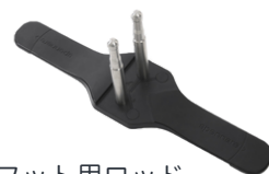
フットとフット用ロッド