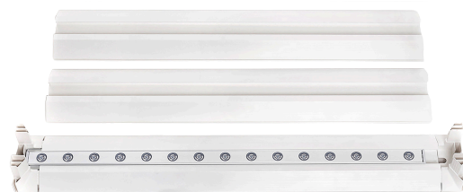
フレーム（1つはLEDライト付き）