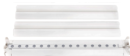
フレーム (1つはLEDライト付き)