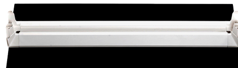
天板付きトップフレーム